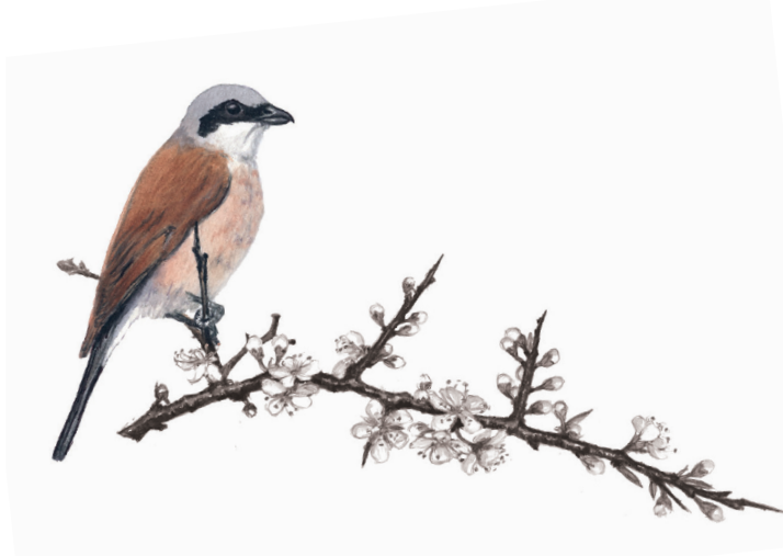
Törnskatan sitter i toppen på busken och spanar ut över de öppna betesmarkerna.

I reservatet Prästaskogen ska man inom projektet Bushlife genomföra följande åtgärder: